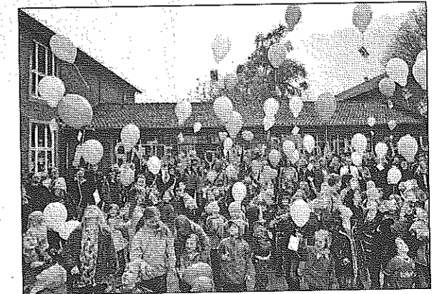
SYMBOLISCHE HAUSÜBERGABE IM APRIL: Kinder feiern, dass sie Montessori-Schüler sein werden.

Bürgermeister Stephan Weil zeigte sich mehr als begeistert: „Ein solches Projekt so schnell zu realisieren, ist eine stolze Leistung.“ adt